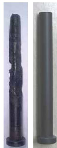
処理なし タイマ P